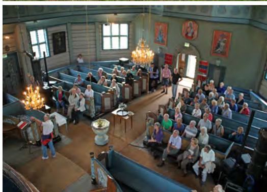
Bilder fra historielagets turer. Øverst: Tur til Kystens arv og Husnes fort 14. juni 2006. Det var stemningsfullt inne i fjellet på Husnes fort. I midten: Steinviksholmen - tur fra Trondheim med SDS Hansteen 2. juni 2009. Båten legger til kai. Nederst: Klæbu kirke 28. august 2015.

som er besøkt på turene våre. I starten ble turene arrangert på ettermiddagstid, men etter hvert har vi gått over til hel-dagsturer. Busskapasiteten har blitt stadig utvidet på turene, de siste par år har det vært to-etasjes buss for å kunne tilby plass til stadig flere deltakere.