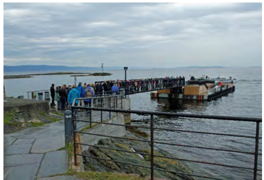
Øverst: Sognli forsøkgård 8. juni 2004. Nederst: Munkholmen 31. august 2016.