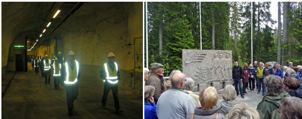
Til venstre: Besøk i Ladehammeren rensanlegg 31. januar 2011. Til høyre: Tur til Falstad og Frosta 17. juni 2015. Minnesmerket ved retterstedet i Falstadskogen.